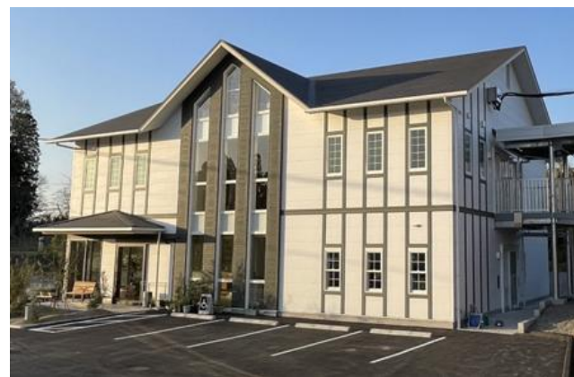
なごみ園 (就労B＋生活介護＋放課後デイ)