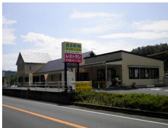
どんこの里いぬかい (生活介護＋就労支援)