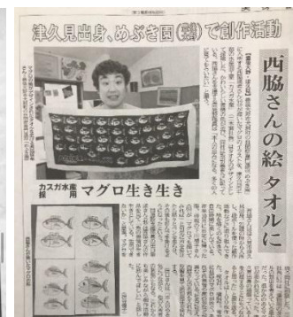
フランスの作品展への出展 (株) カスガ水産とのコラボ