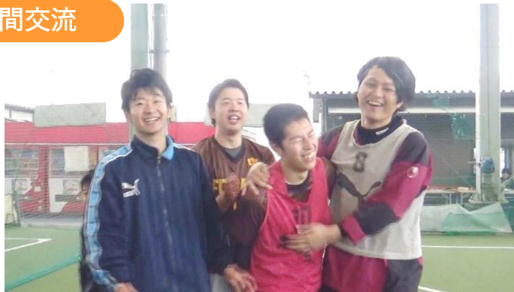
サッカーサークル