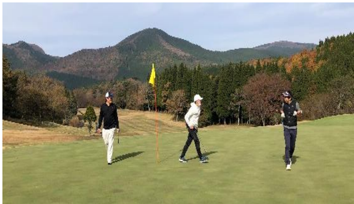
ゴルフ・釣りなど趣味による交流