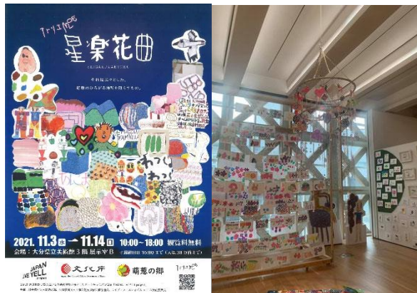
大分県立美術館3階を貸し切ったの展示会 (来場者2000人以上)