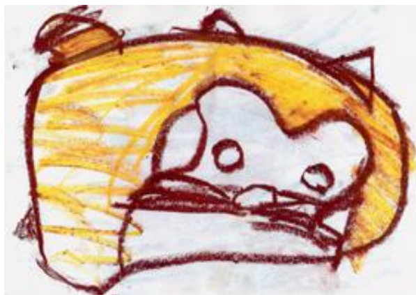
らすかる (ホームヘルプサービス)