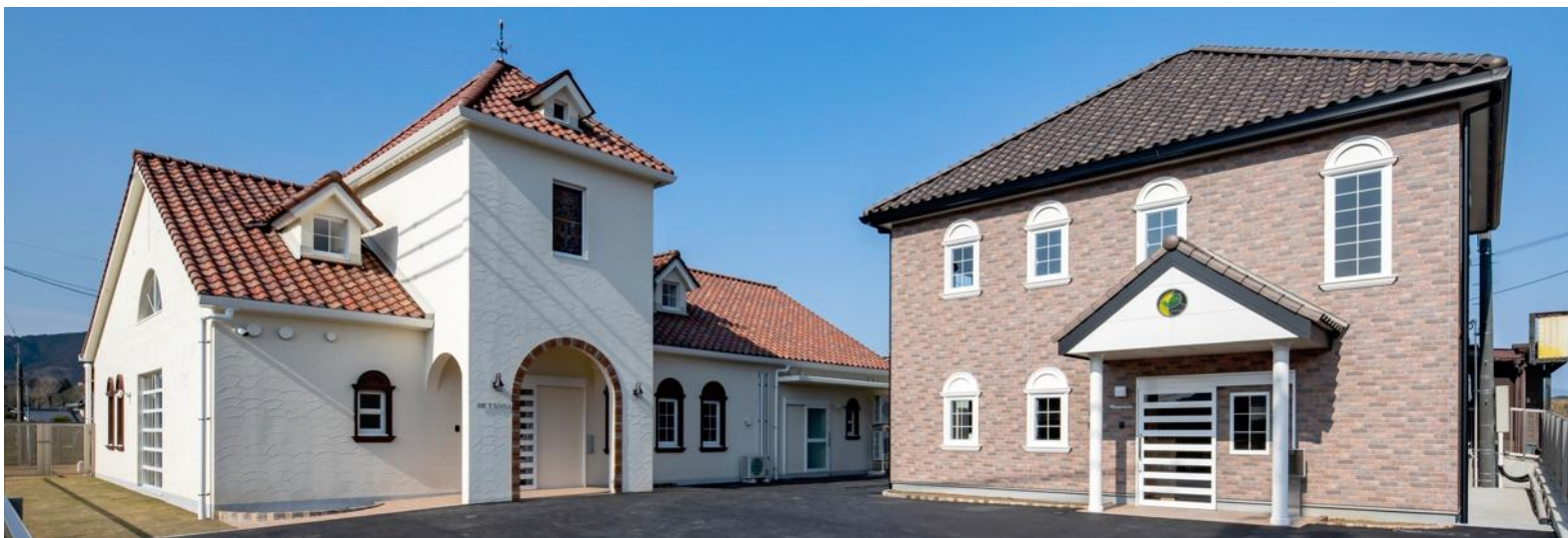
へつぎ保育園（小規模保育園）