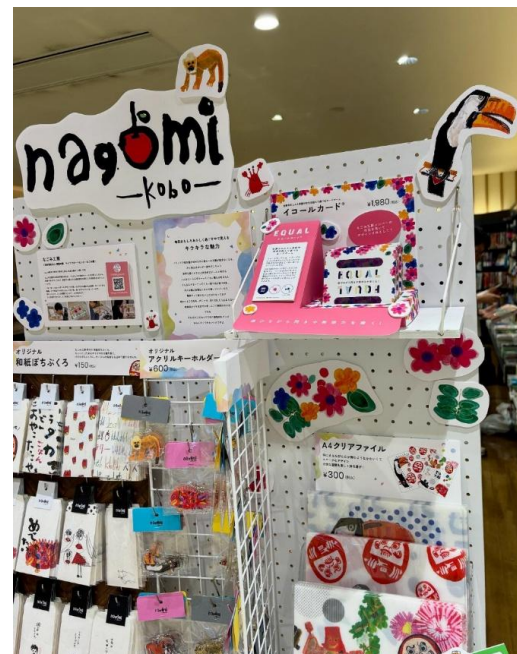
紀伊國屋書店 (アミュプラザおおいた)