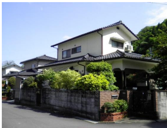
グループホームかわしま