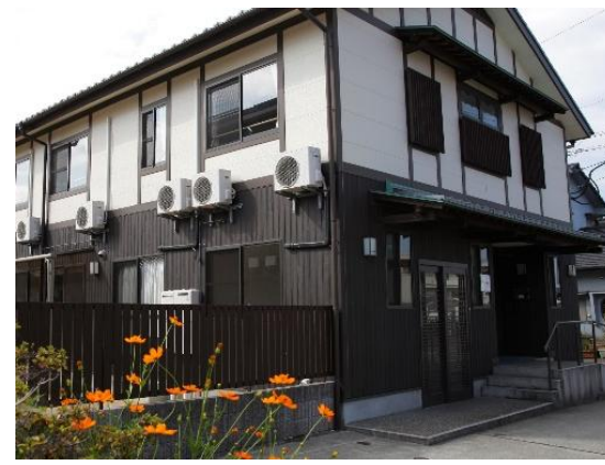
グループホームかわしま【戸次棟】