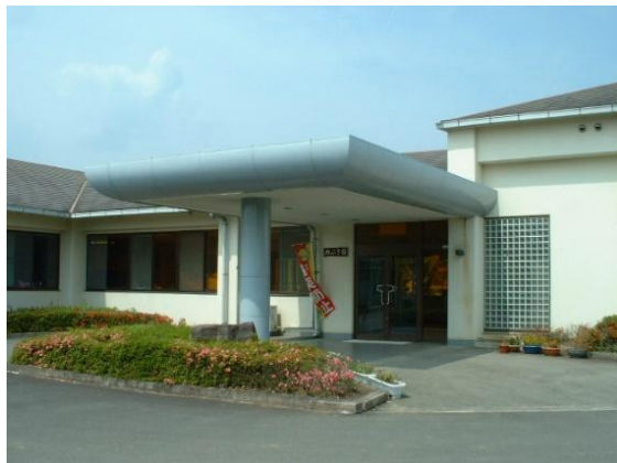
めぶき園 (障害者支援施設)