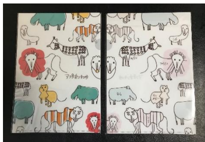
アフリカンサファリとのコラボ