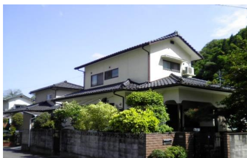
グループホームかわしま