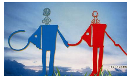
ECOAL （県内唯一の発達障害専門の相談機関）