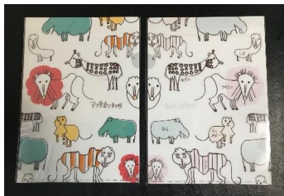
アフリカンサファリとのコラボ