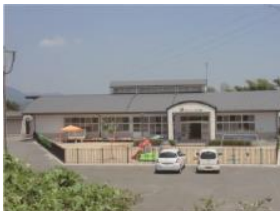
なかよしひろば（児童発達支援＋放課後デイ）