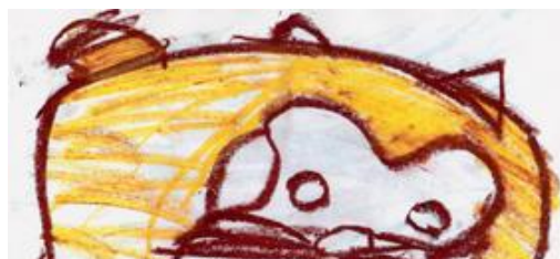
らすかる （ホームヘルプサービス）