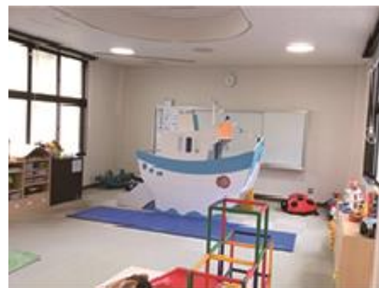
ゆうゆうキッズ（子育て支援センター）