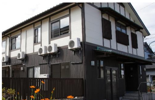
グループホームかわしま（戸次棟）