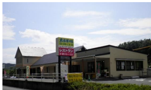
どんこの里いぬかい （生活介護＋就労支援）