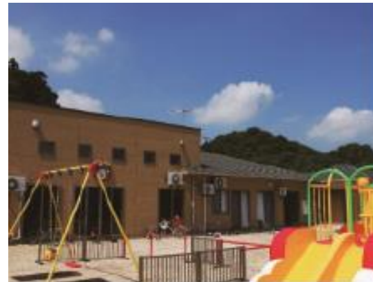
大分なごみ園（児童発達支援＋放課後デイ）