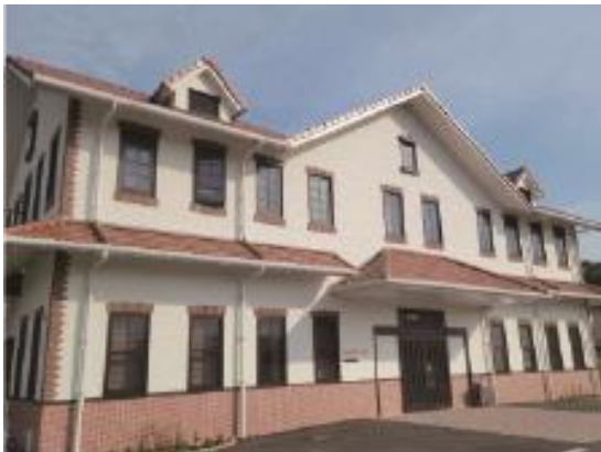
わくわくかん（児童発達支援＋放課後デイ） プラスα（相談支援）