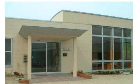
なごみ園（成人＋児童）