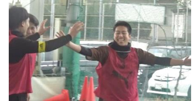
サッカーサークル