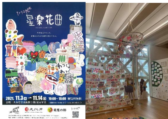
大分県立美術館3階を貸し切ったの展示会 （来場者2000人以上）