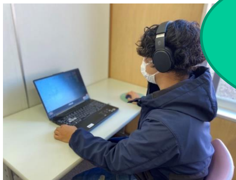
元音響エンジニア