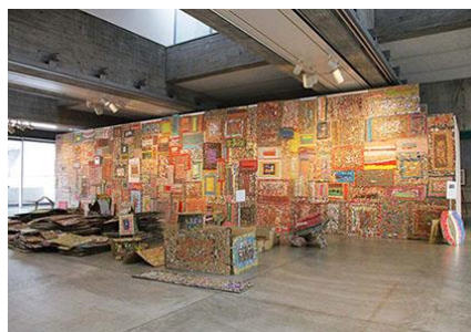
大分市美術館での展示