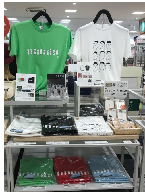
東急ハンズ大分店 (アミュプラザおおいた)