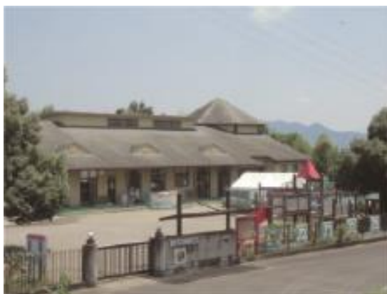
いぬかいこども園（認定こども園）