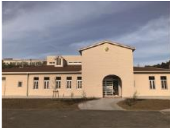
こざいこども園（認定こども園）