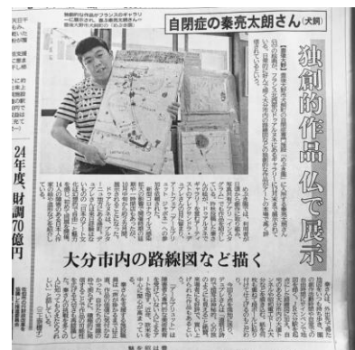
フランスの作品展への出展 （株）カスガ水産とのコラボ