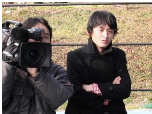
元TVディレクター（係長）