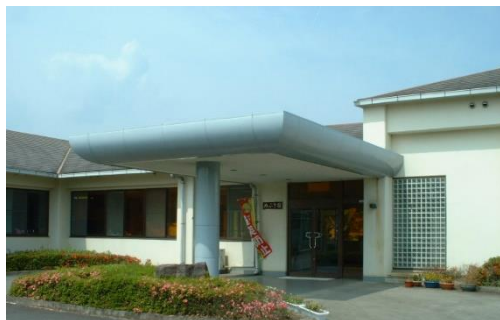
めぶき園（自閉症入所施設）

障害者入所支援・生活介護・就労支援・共同生活援助・相談支援・居宅介護・行動援護など