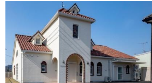
へつぎ保育園（認可保育園）