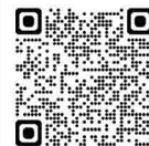
大分県 5歳児指導の記録

こどもの育ちを最大限保障していくために、幼児教育保育施設における質の向上やインクルージョンに向けた切れ目のない支援が望まれる中、大分県では大分県子ども未来課のもとで医療、福祉、教育、行政の有識者と幼児教育保育施設の各団体が協働して幼児教育保育施設と学校、発達支援センター等で教育保育の経過を共有できるアセスメント表を作成しました。本アセスメントは「幼保連携型認定こども園幼稚園教育保育要領（保育所保育指針）」内の養護と五領域に基づいて構成しており、こどもの「育ち」を学期毎に分けながら視覚化することで一人ひとりの個別的な配慮を共有するだけでなく、保護者をはじめとする関係諸機関の支援者にも教育保育の内容を伝達する際に活用を勧めています。本アセスメント表は大分県のホームページにて「5歳児指導の記録」として公開していますので、関心のある方はご覧ください。