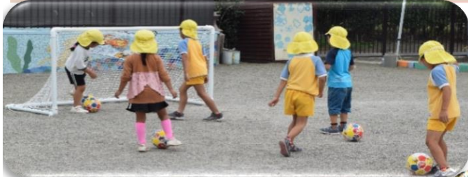
スポーツの秋! JFAから贈呈していただいた、サッカーゴールとボールを使って、楽しく遊んでいます