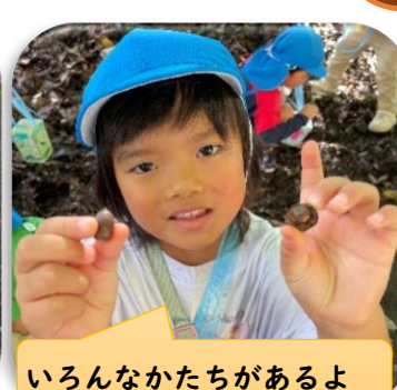
いろんなかたちがあるよ