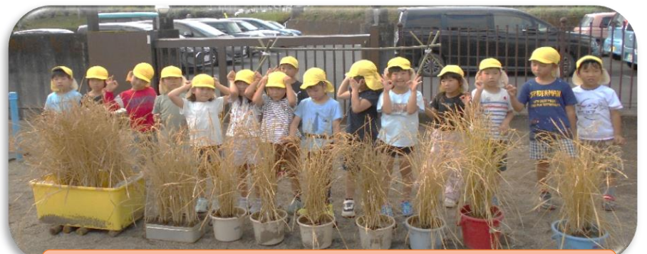
さくら組が稲刈りをして収穫の喜びを分かち合いました