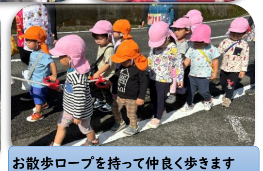
お散歩ロープを持って仲良く歩きます