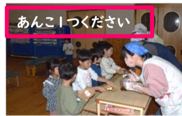
あんこ!つくください