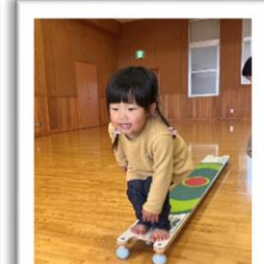
なかよしホールであそびました。せーの!ジャンプ!