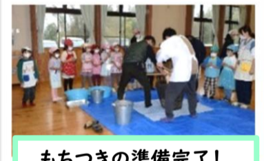
もちつきの準備完了!