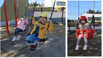
設置が待ち遠しいたんぽぽ組のお友だち