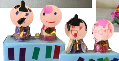
プリンカップで作ったよ