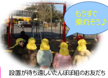
もうすぐ乗れそう♪