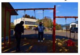
初試乗は、園長先生!