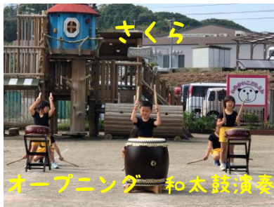
オープニング 和太鼓演奏