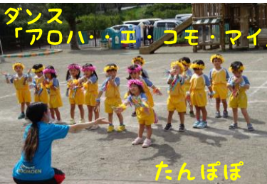
ダンス「アロハ・エ・コモ・マイ」